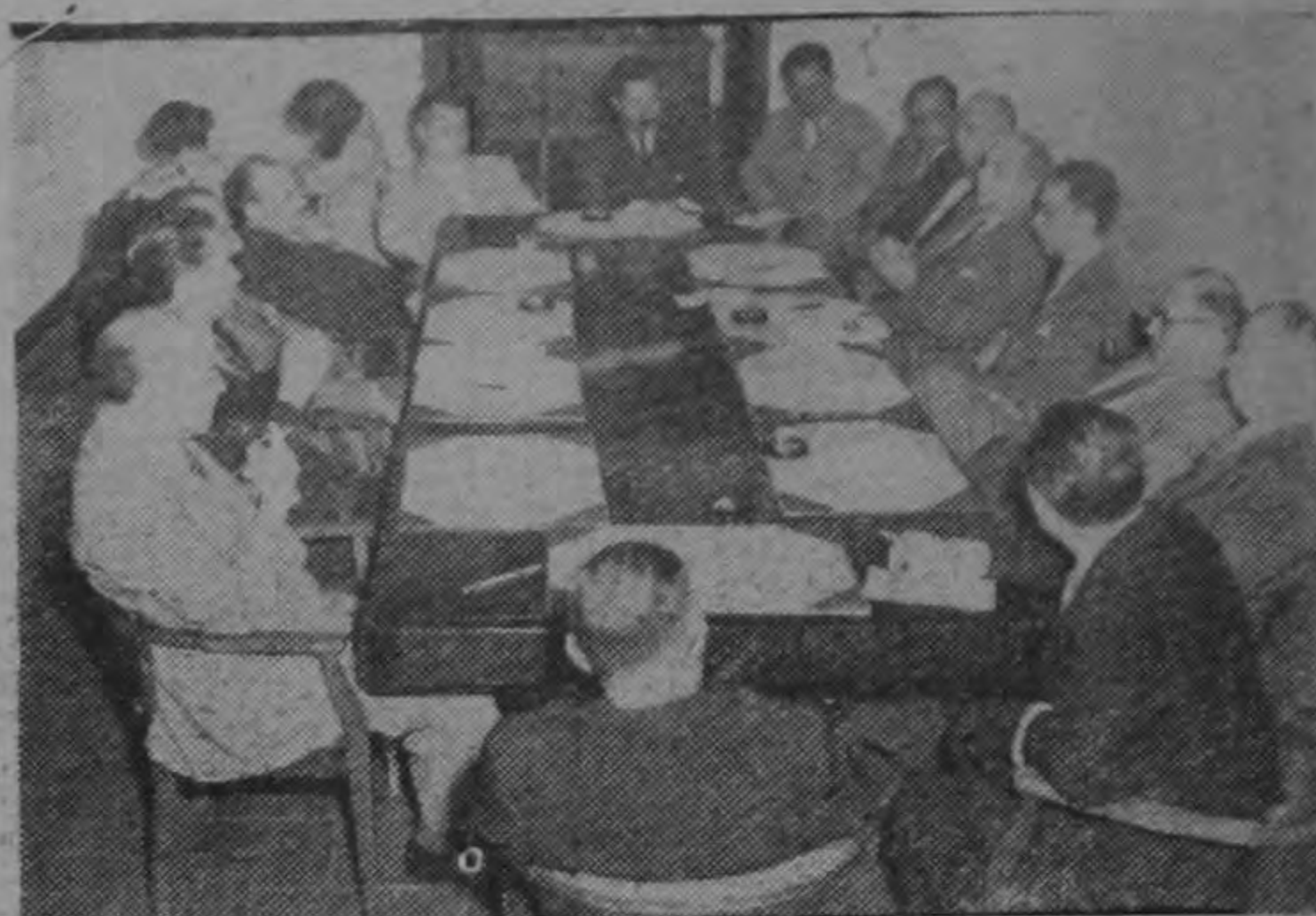
Los integrantes de la Comisión de la CEPAL, que están en Costa Rica, asisten a una reunión de la Junta Directiva de la Cámara de Industrias.