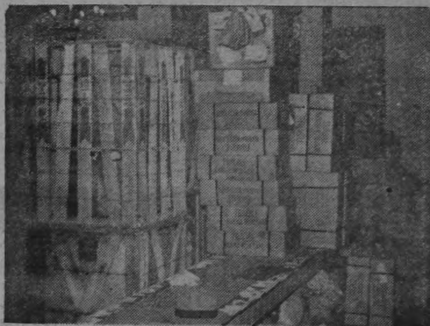
Se atascó otra vez la Aduana del Aeropuerto, y, como puede apreciarse, ya los turistas no pueden moverse, porque no caben. A uno de ellos, lo único que le cupo fué el sombrero. (Información en página 4)