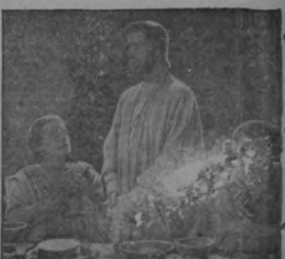
Entonces Jesús, con el espíritu turbado, miró a Sus discípulos y exclamó: "En verdad os digo que uno de vosotros me traicionará".