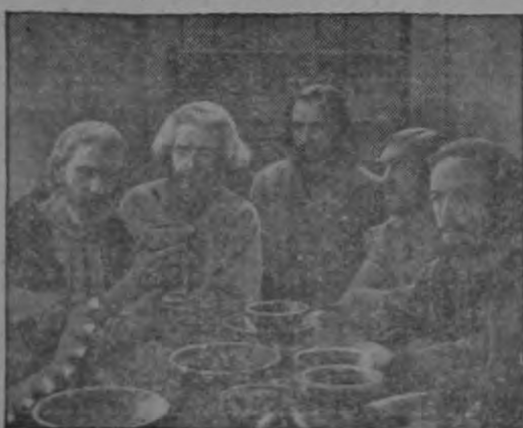
El cáliz fué así pasando entre todos los discípulos, de unos a otros, y bebieron de él tal como Jesús les había pedido que hicieran.