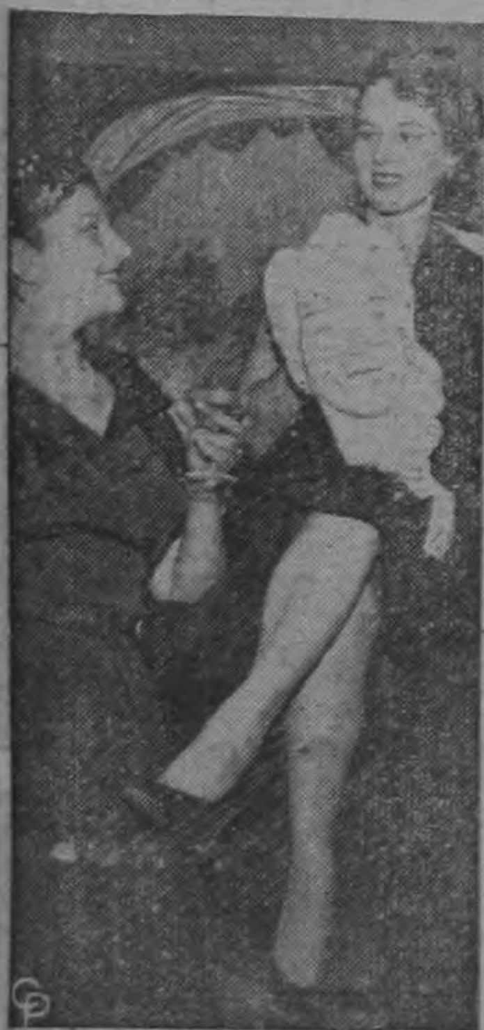
Lucine Amara ofrece un brindis a la cantante de ópera Nadine Conner en el décimo aniversario de su debut en la Compañía Metropolitana de Ópera de Nueva York. Miss Conner sujeta un busto de ella que le fué obsequiado durante la fiesta.