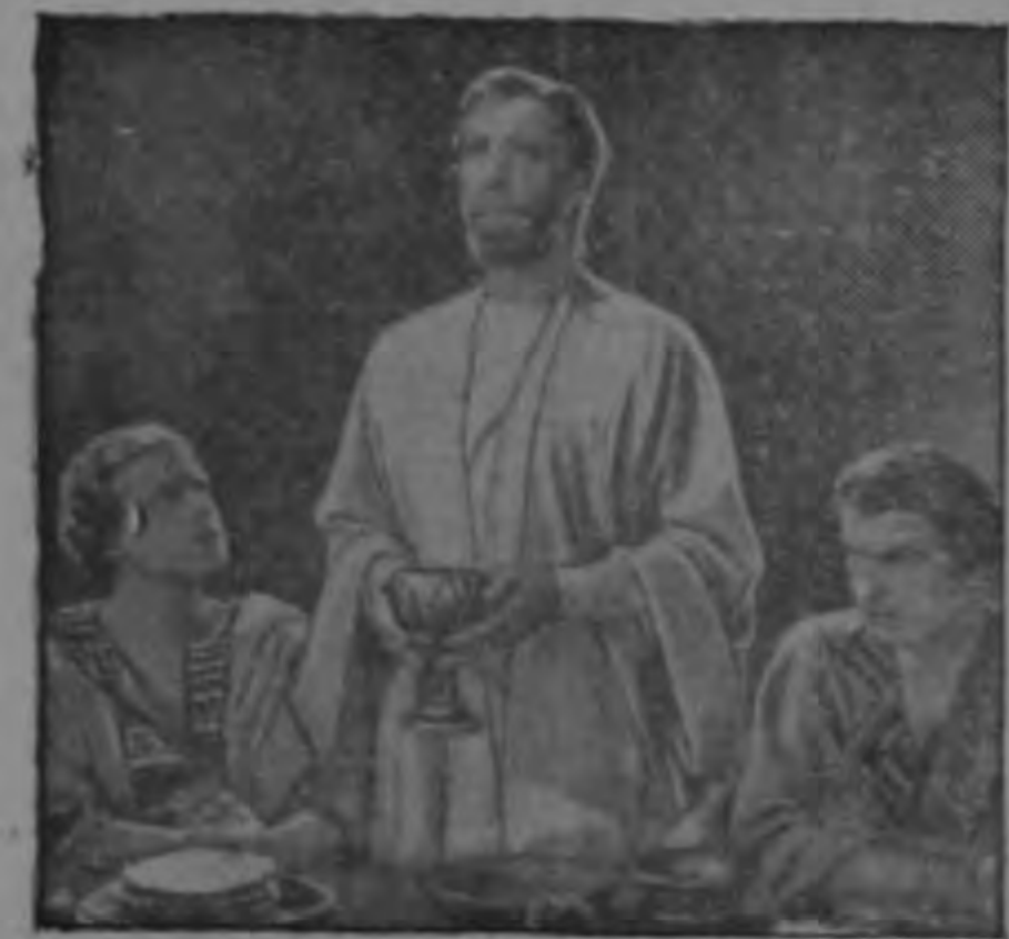
Después de la cena, Jesús tomó entre sus manos el cáliz de vino y dijo: "Tomad todos de este vino que es Mi sangre del nuevo testamento".