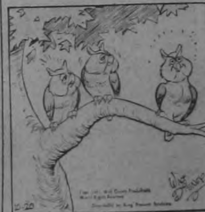
—No puedo corregirlo... insiste en dormir de noche!

TEATROS Y ESPECTACULOS EN PAGINAS 14, 15