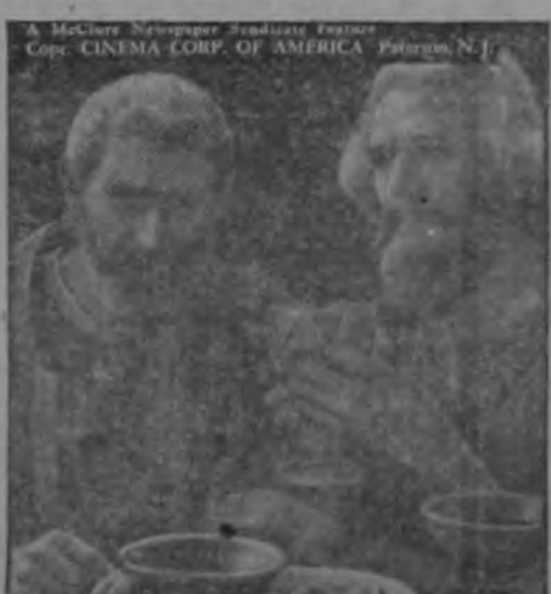
Y al terminar de beber del cáliz bendito por Jesús, Sus discípulos se pusieron a pensar en la sabiduría de sus palabras.